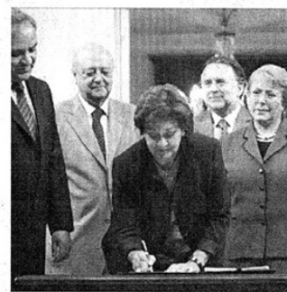
El anuncio lo realizó la autoridad ministerial en el marco de la ceremonia de firma del proyecto de ley que crea el Sistema Nacional y la Agencia de Inocuidad de los Alimentos, encabezada por la Presidenta Michelle Bachelet, y que será enviado a trámite por el Ejecutivo.